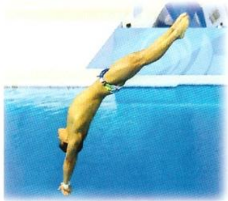
..... ПРЫЖКИ В ВОДУ