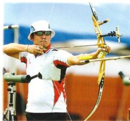
СТРЕЛЬБА ИЗ ЛУКА